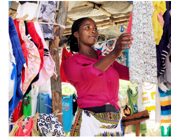
Venda de roupas num mercado em África

Os membros da Federação Humana People to People são auditados de acordo com normas financeiras e de relatórios internacionais. Isto inclui fundos recebidos por parceiros internacionais, também contabilizados em linha com os acordos da parceria.